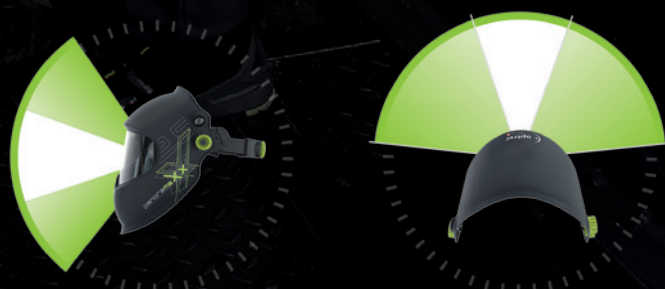
Srovnání zorných úhlů standardních kazet s panoramaxx