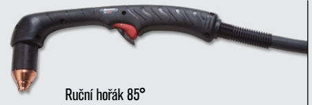
Ruční hořák 85°

(více volitelných možností hořáku viz www.hypertherm.com )