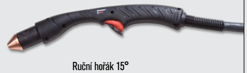
Ruční hořák 15°