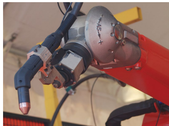
Robotické 3rozměrné řezání