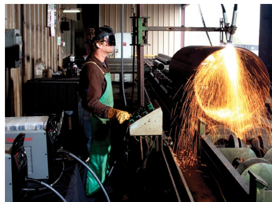
Řezání a úkosové řezání trubek