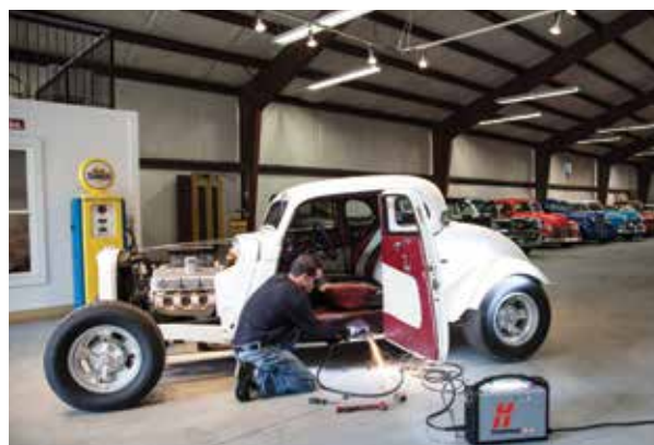
opravy a úpravy vozidel,