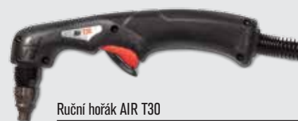
Ruční hořák AIR T30