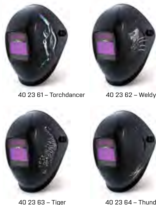
40 23 61 – Torchdancer